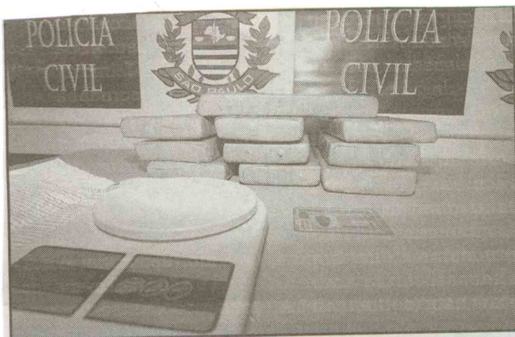
Foram apreendidos 10 tabletes da droga e uma balança de precisão