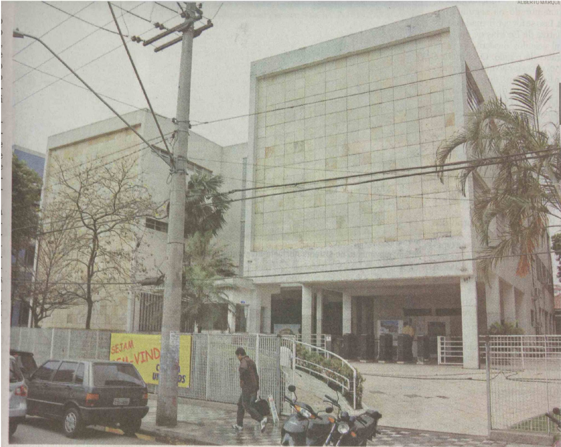
Em números absolutos, a UniSantos (Católica) foi a que mais se destacou, incluindo 55 postulantes aprovados na lista de 107 pessoas