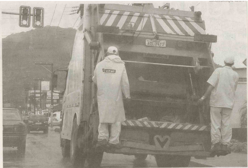
O serviço de coleta de lixo será realizado normalmente na cidade neste fim de semana prolongado

Durante o encontro realizado com os vereadores, os repre-