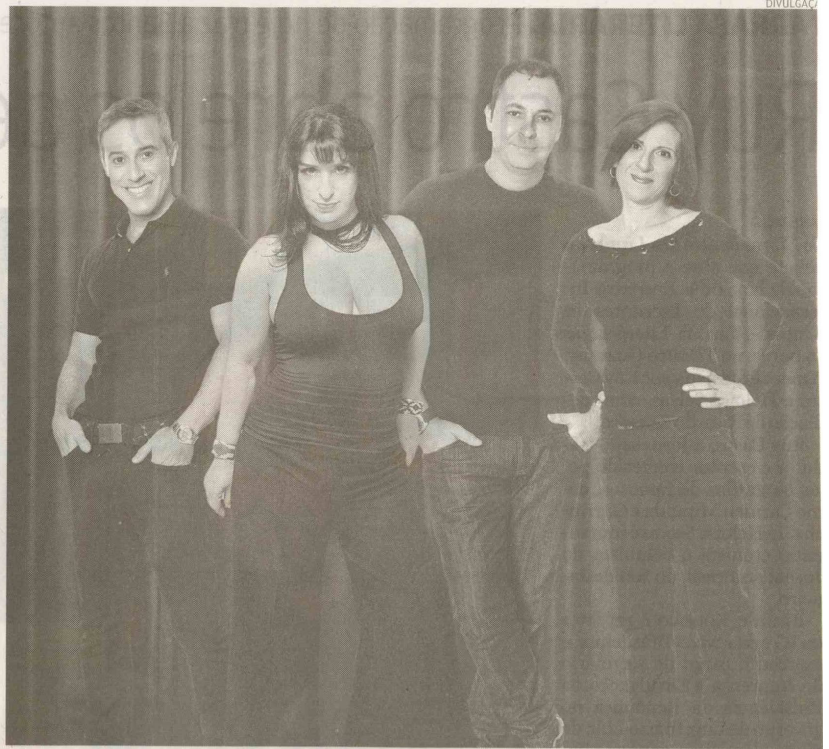
Em 8 Anos Luz , os atores fazem rir de situações novas, sem temas repetitivos ou piadas preconceituosas

Ingressos para 8 Anos Luz custam R$ 25,00, R$ 40,00 (para assinantes de A Tribuna ) e R$ 50,00. Av. D. Pedro I, 350, Enseada, tel. 3386-8987.