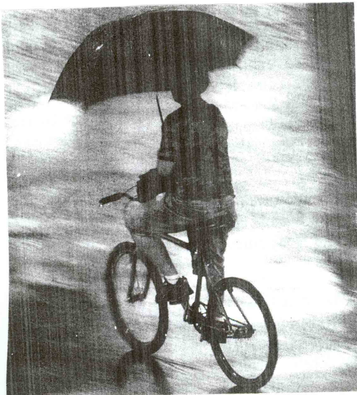
Depois de vários dias de calor, voltou a chover desde o final da tarde

A Tribuna Sexta-feira, 04 de Setembro de 2009