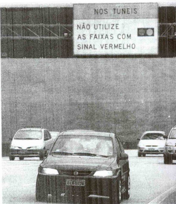
Ontem, movimento no Sistema Anchieta-Imigrantes era normal

A Ecovias informará em tempo real, a partir de hoje, o tempo estimado de viagem para as cidades da Baixada Santista. Dez painéis de mensagem variável instalados nas Rodovias Anchieta, Imigrantes, Padre Manuel da Nóbrega e Cônego Domênico Rangoni mostrarão, além da situação de momento das estradas, como congestionamento e acidentes, o tempo que o motorista levará para chegar ao destino desejado e a velo-